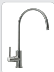
Rubinetto 1 VIA