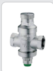
Riduttore pressione H2O