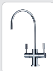
Rubinetto 2 VIE