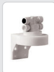
Testata con VNR